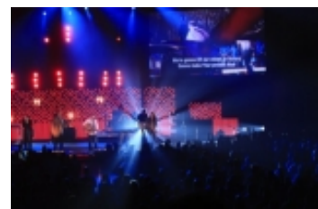
Lobpreis @ Catalyst