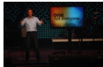
Andy Stanley @ Catalyst